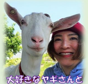
大好きなヤギさんと