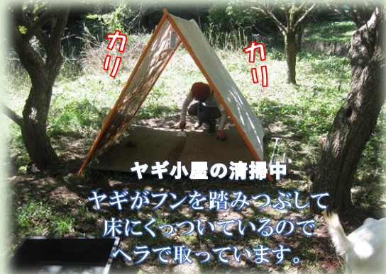
ヤギ小屋の清掃中